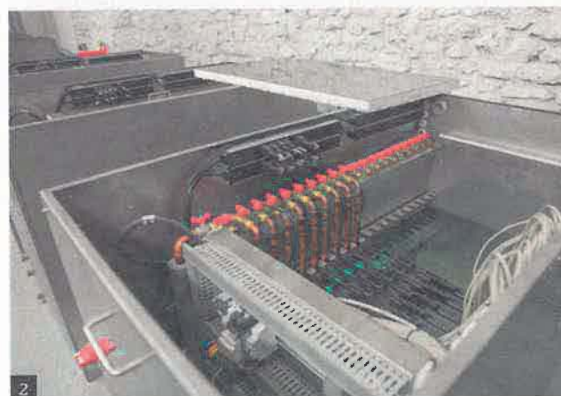
GERARD SIZNEZ / MAURICE DE PARIS

L'équipement permettra de maintenir la température de l'eau (700 m 3 ) à 28 °C toute l'année et de couvrir 20 % des besoins énergétiques du bassin. Au total, plusieurs milliers d'euros économisés pour une installation d'environ 100 000 euros. D'autres associations de ce type devraient suivre en France pour les besoins de data centers de collectivités, notamment. Histoire de se rafraîchir les neurones après avoir bien planché. ● Stéphanie Obadia