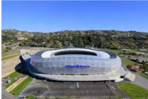
L'Allianz Riviera, à Nice.