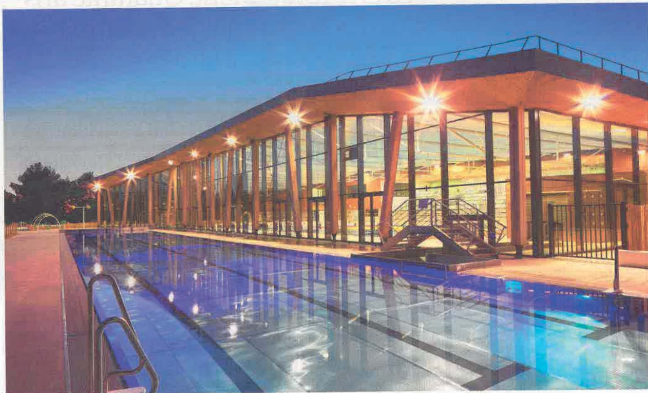
Inaugurée en 2016, la piscine Sainte-Victoire à Venelles (Bouches-du-Rhône) a fait l'objet d'un contrat réalisation, exploitation, maintenance. Outre trois bassins chauffés au bois, elle abrite une salle de musculation et une aire de jeu.

commission piscines publiques de la Fedair'sport (1). Ces équipements vétustes pèsent dans les budgets communaux : ils requièrent une maintenance lourde et engloutissent des calories. « En moyenne, une piscine représente entre 20 et 30 % des consommations énergétiques du parc immobilier d'une commune », indique Matthieu Kirchhoffer, expert en traitement de l'eau chargé des centres aquatiques franciliens chez Engie Cofely. Outre qu'ils représentent des gouffres financiers, ces ouvrages