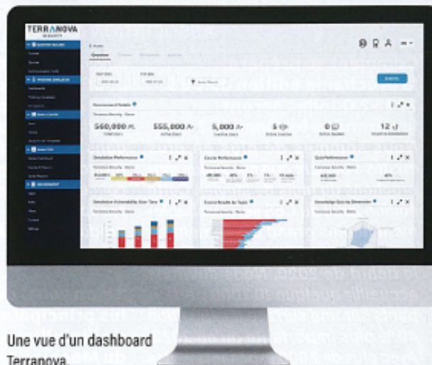
Une vue d'un dashboard Terranova.

Comment expliquer ces mauvais résultats de l'Hexagone ? La faute est-elle entre la chaise et le clavier, comme on se plaît souvent à l'affirmer ? À la question « La formation à la cybersécurité n'est pas nécessaire », les Français sont plus nombreux à être en désaccord : seuls 22% approuvent cette phrase, le pourcentage le plus bas des cinq pays, et 55% pensent au