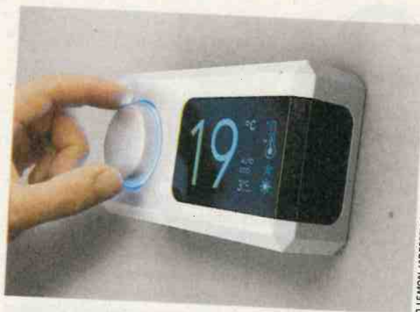
L'une des mesures à mettre en place est la baisse de température à 19 °C, au lieu de 20 °C, dans les bureaux administratifs.

La métropole de Bordeaux (28 communes, 5400 agents, 814.000 hab.) a aussi sorti la calculatrice pour aboutir au même