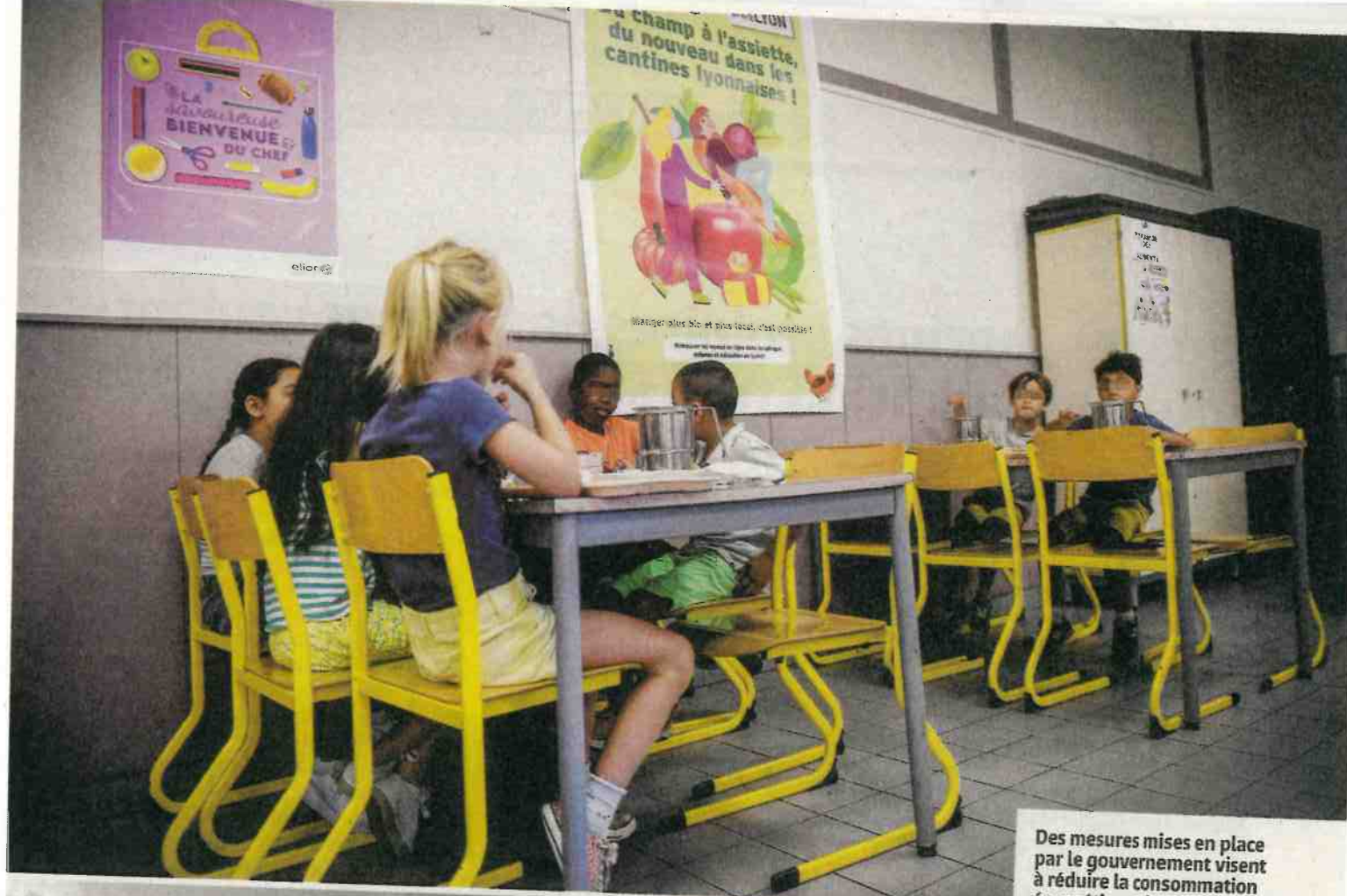
Des mesures mises en place par le gouvernement visent à réduire la consommation énergétique de 10%, au regard des chiffres de 2019. Elles touchent notamment des services tels que les cantines scolaires, les RH et les piscines.