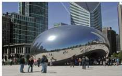
Intervenir sur l'espace public (qualifier, créer une destination, aménager un parcours marchand)