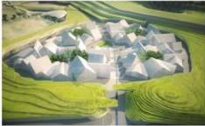
Miser sur les valeurs du local (local is beautiful)