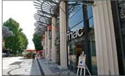
Une proposition marchande forte et diversifiée (commerçants indépendants et enseignes nationales)