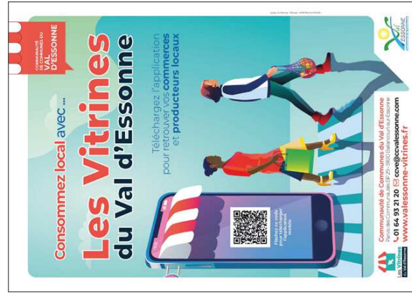
Communauté de communes du Val d'Essonne

Chacune des techniques proposées ne bénéficie pas simplement aux commerces locaux mais à l'ensemble de la collectivité. La mutualisation des outils et services numériques à l'échelle du centre-ville contribue à dynamiser le centre-ville, et à affirmer plus facilement une identité commune.