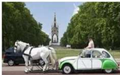
Développer l'accessibilité (nouvelles mobilités, praticité, traitement du stationnement...)