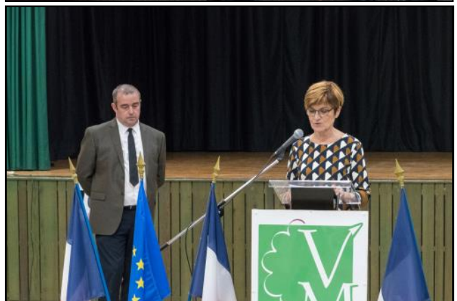
Quelques membres de la Commission extra-municipale