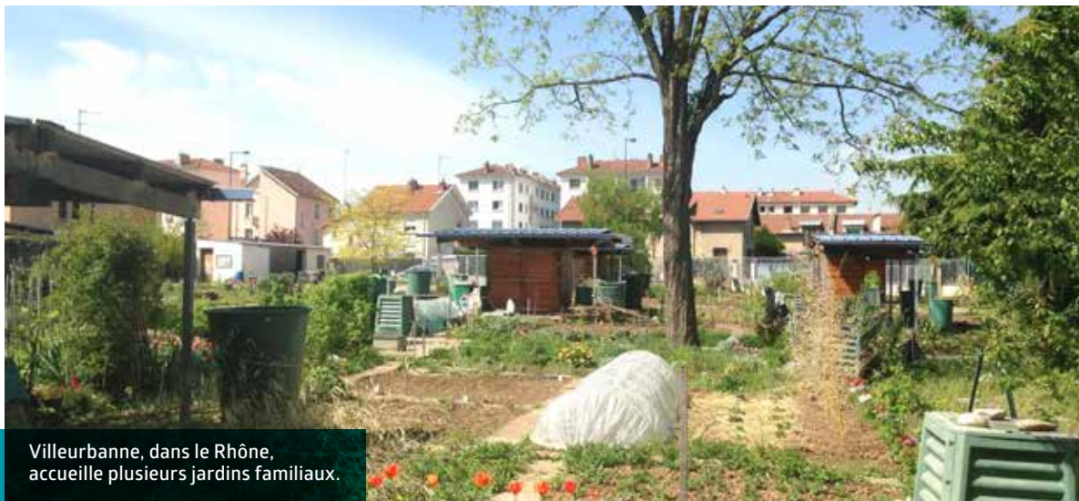
Villeurbanne, dans le Rhône, accueille plusieurs jardins familiaux.