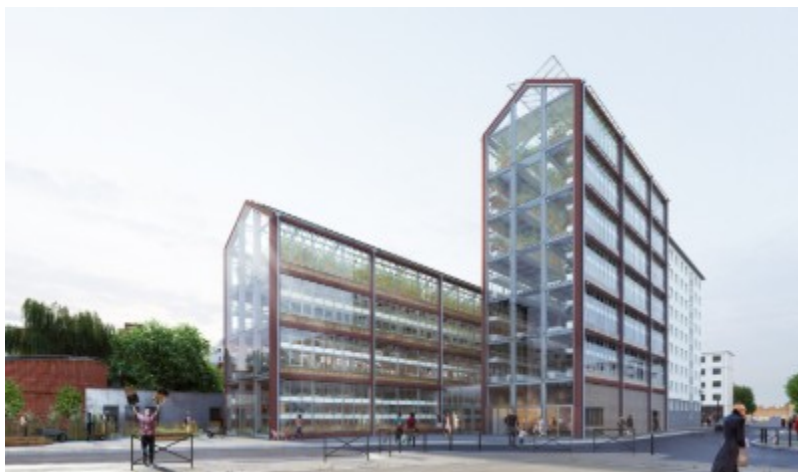
La Cité maraîchère de Romainville proposera des produits d'alimentation de qualité et accessibles au plus grand nombre.

Créer un service public qui réconcilie la ville avec la campagne. Tel est l'objectif que s'est donné la ville de Romainville en se lançant dans la construction d'une cité maraîchère en plein cœur du département de Seine-Saint-Denis.