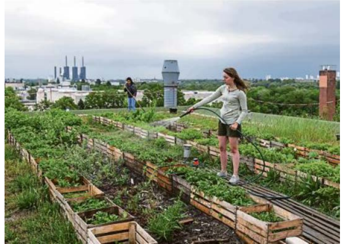
Le besoin de nature en ville risque de s'intensifier. Les toits pourraient être davantage investis pour apporter de la verdure. Les fermes urbaines pourraient se développer.