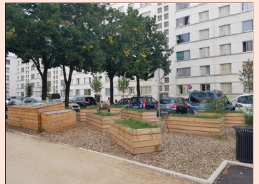
Les travaux de réaménagement des espaces extérieurs ont été réceptionnés jeudi 30 juillet.

L'éclairage a également été revu et les accès du cen-