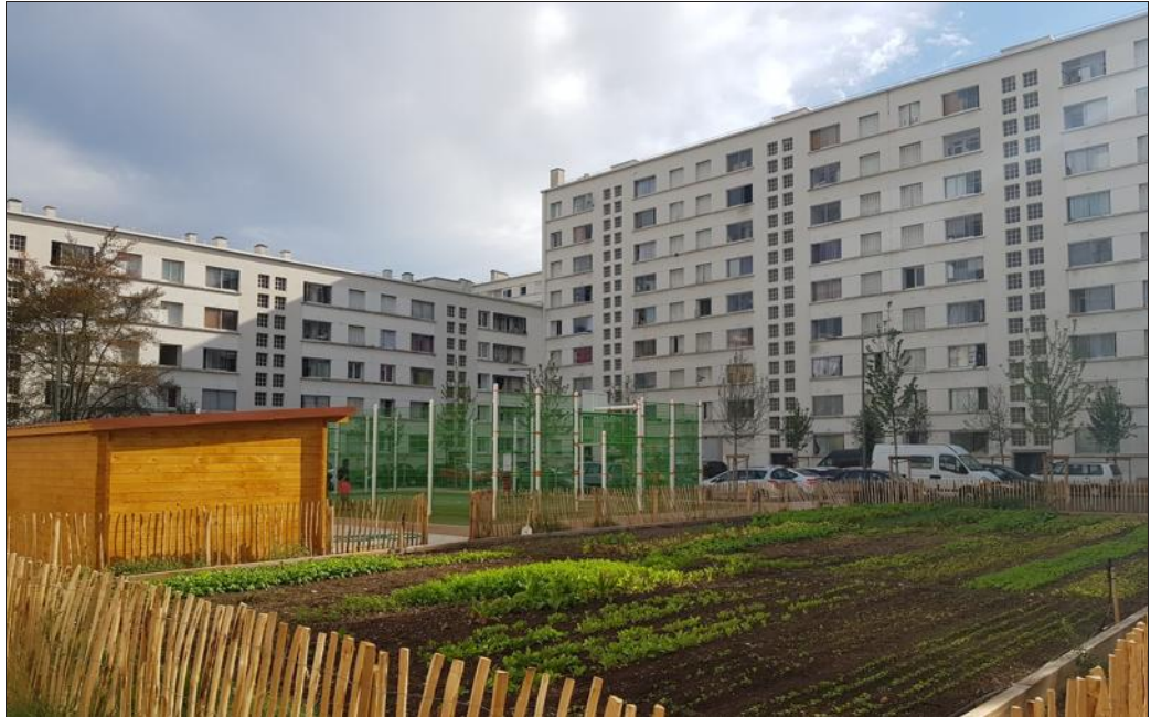
Cet espace d'agriculture urbaine propose des activités autour de l'agriculture respectueuse de l'environnement, des plantations alimentaires saines et durables et de l'amélioration du cadre de vie.

Baptisé le 8 e Cèdre, cet espace d'agriculture urbaine au cœur du quartier propose des activités autour de l'agriculture respectueuse de l'environnement, des plantations alimentaires saines et dura-