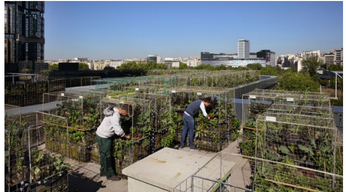
La ferme urbaine Peas & Love sur le toit d'un hôtel dans le quartier Grenelle de Paris.

L'équation économique semble difficile à résoudre, même si l'agriculture en ville n'est pas non plus sans intérêt. « Il peut être très pertinent de cultiver en ville tous ces aliments qui nécessitent un environnement contrôlé, en 'indoor' », estime Christine Aubry, directrice de recherche agriculture urbaine à AgroParisTech. La lavande pour les cosmétiques ou les herbes aromatiques,