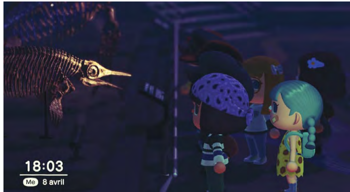
Les visites se dématérialisent, en live Facebook, en réalité augmentée ou même en jeu vidéo avec le museum d'histoire naturelle d'Angers.