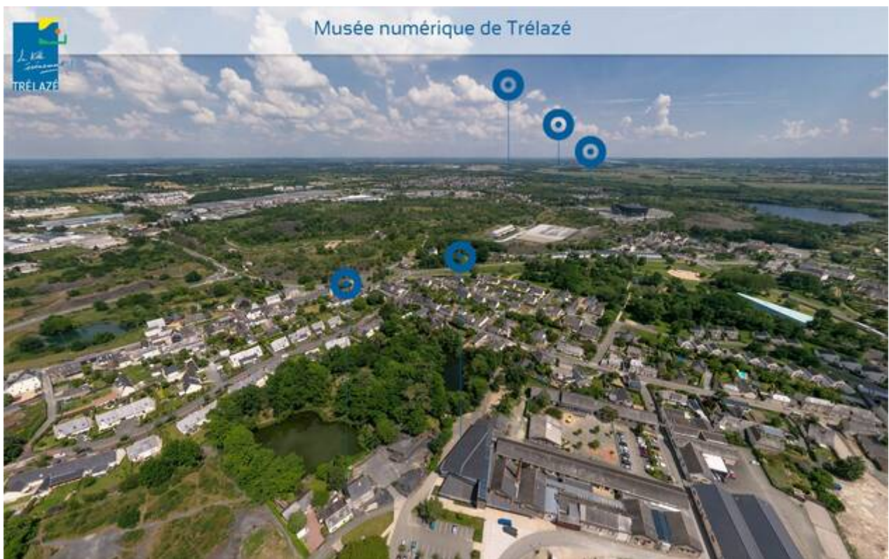
Sur le site internet, la navigation commence par la vue aérienne de la ville de Trélazé.

Une fois arrivé sur le site internet, une vue aérienne de Trélazé s'affiche et fait apparaître de petits cercles bleus. Ces pastilles sont placées sur des lieux emblématiques de la ville, que l'on va considérer comme différentes salles d'un musée. Il suffit de cliquer sur une de ces icônes pour entrer dans la salle.