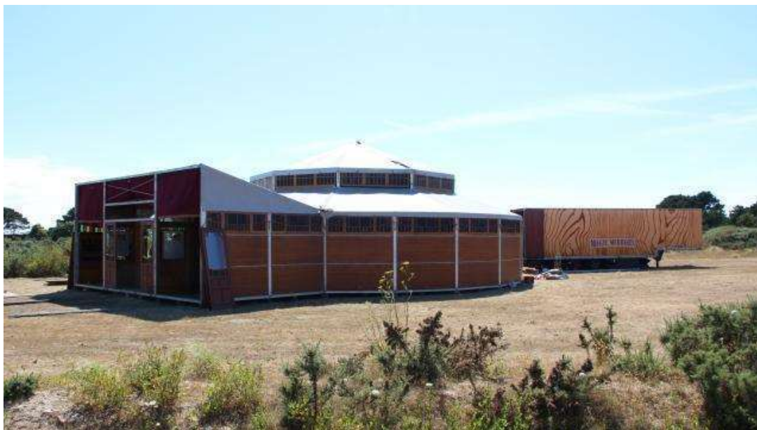
Le Magic Mirrors ouvrira le vendredi 29 juillet à Treffiagat (Finistère).

La prochaine ouverture de la discothèque éphémère, le Magic Mirrors, à Treffiagat (Finistère), provoque la colère des patrons de discothèques du Finistère. Pour les organisateurs, il y a un manque à combler.