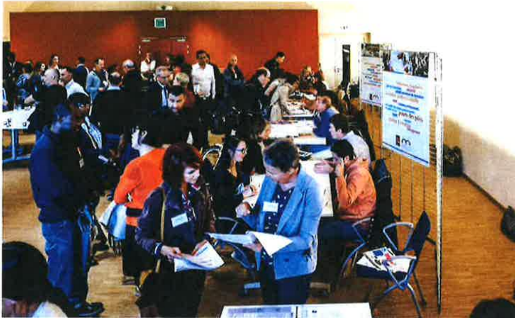
À Mulhouse, l'accueil des arrivants, rebaptisé Forum, a des allures de salon professionnel.