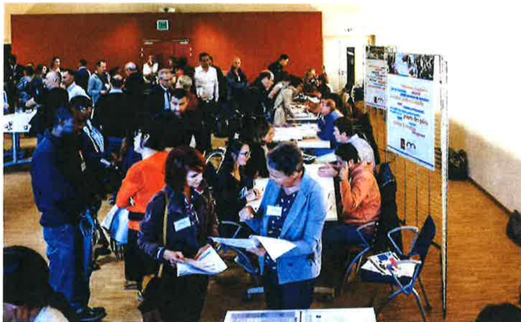
À Mulhouse, l'accueil des arrivants, rebaptisé Forum, a des allures de salon professionnel.